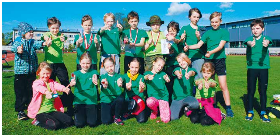
21. mai 2015. a. FAN kolmkvõistluse tublid noorsportlased