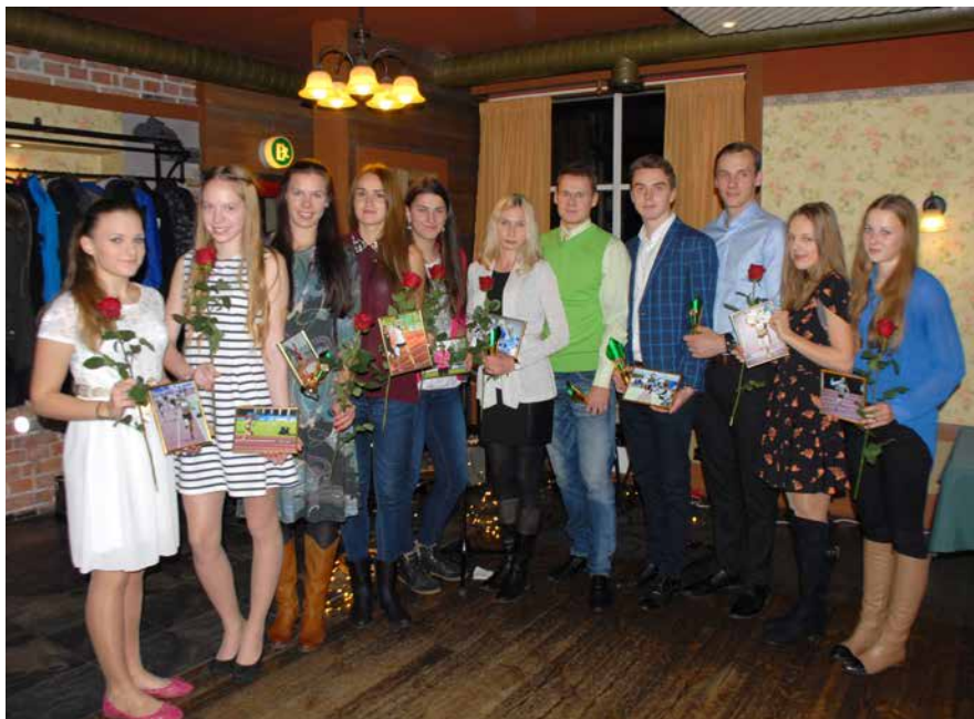
2015. aasta hooaja pidulik lõpetamine ja Nõmme KJK 20. juubel. Kõik parimad koos.