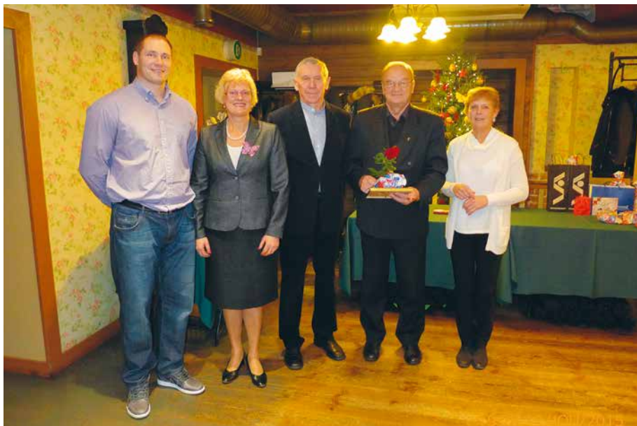
Nõmme KJK 20 juubeli galerii 11. detsembril 2015. a.