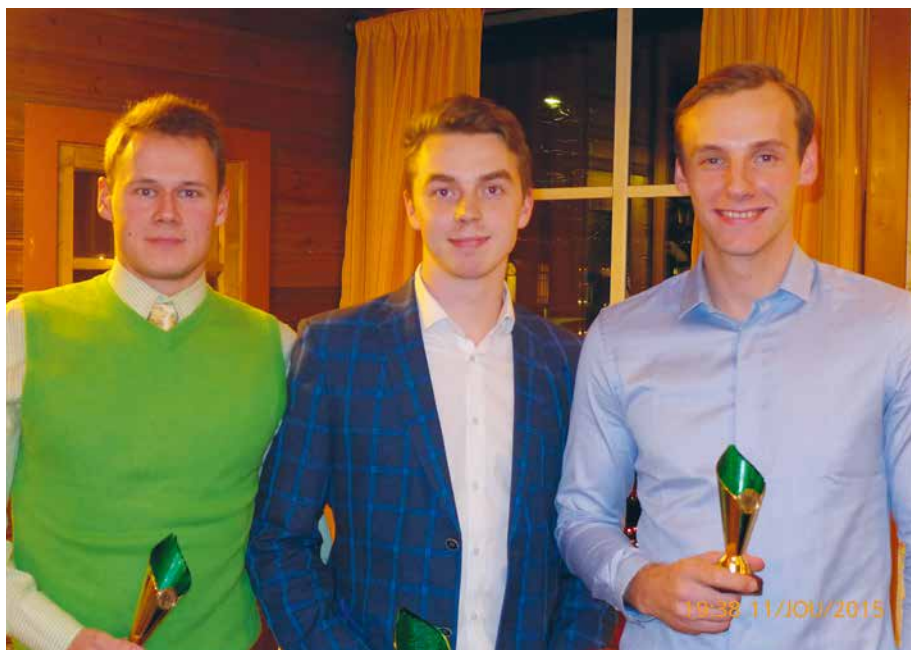
2015. aasta parimad meessportlased meisterlikkuse alusel