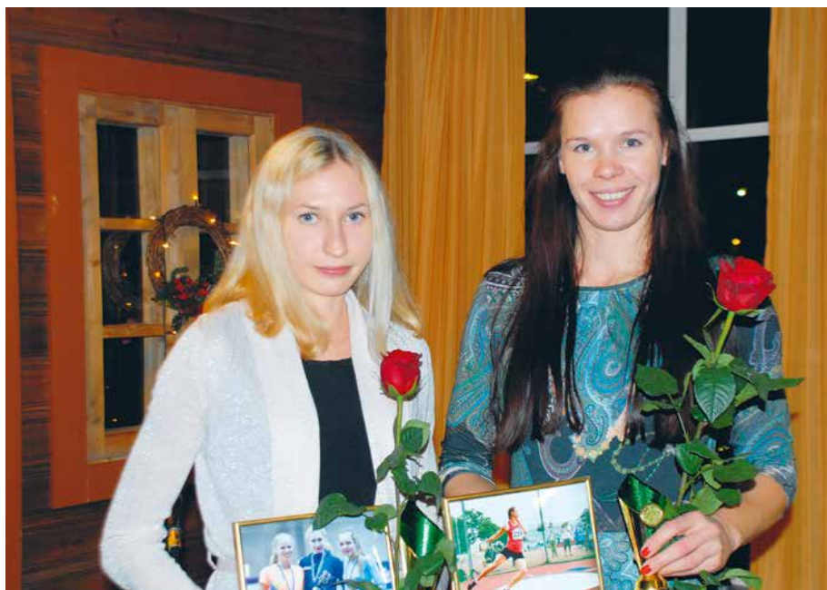
2015. aasta parimad naissportlased meisterlikkuse alusel