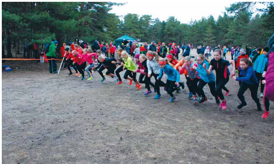
22. aprill 2015; 15. Nõmme Kevadjooksu start